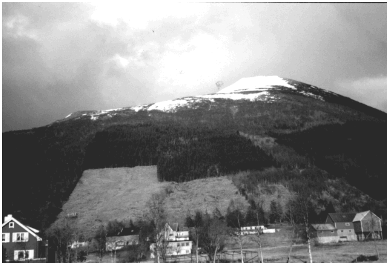
Figur 4.1. Granplantefelt fra Vartdal i Møre og Romsdal. Både økologiske og estetiske hensyn taler mot anleggelse av slike plantefelt i framtida.

miljøeffektene som nevnes i kapitlet om skogreising vil være aktuelle også for alle tiltakene.