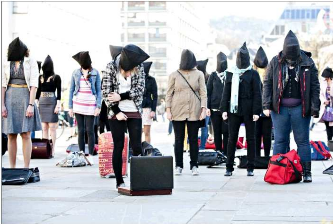
Skuespill på Torgallmenningen for å illustrere hvordan mennesker blir tatt til fange uten rettssak og dom fordi de anses som en sikkerhetsrisiko.